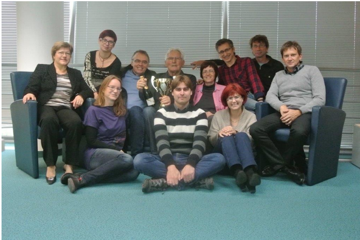
Skoraj vsi CJM-jevci (2014)