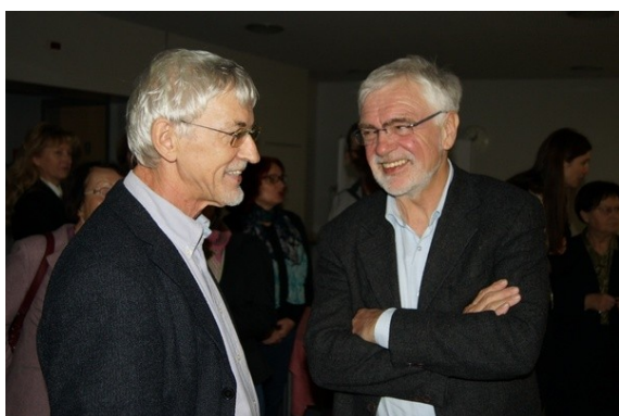
I. Bernik in J. Glazer