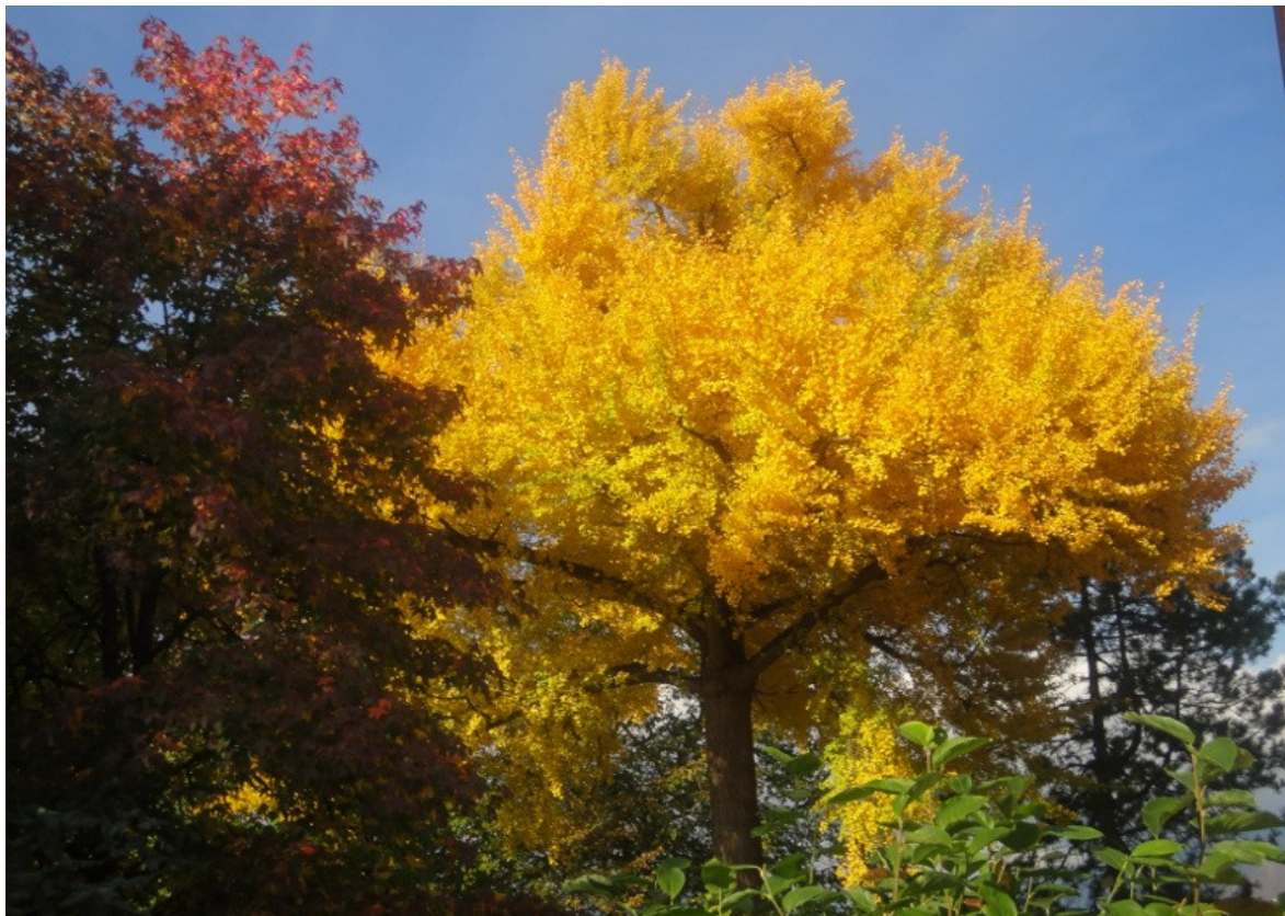
Čudovita jesen (ginko in ambrovec), 2014